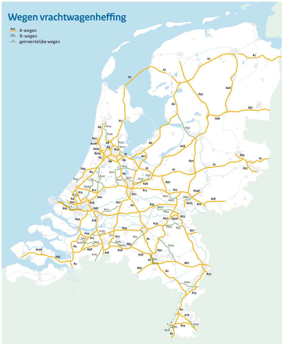
Figuur 2: Heffingsnetwerk van Nederland