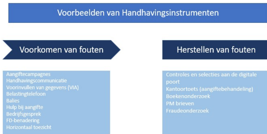
Figuur 4: Voorbeelden van Handhavingsinstrumenten die gericht zijn op het voorkomen van fouten of het corrigeren van fouten.

In figuur 4 zijn voorbeelden van handhavingsinstrumenten opgenomen die enerzijds erop zijn gericht om fouten te voorkomen en anderzijds om fouten te corrigeren.