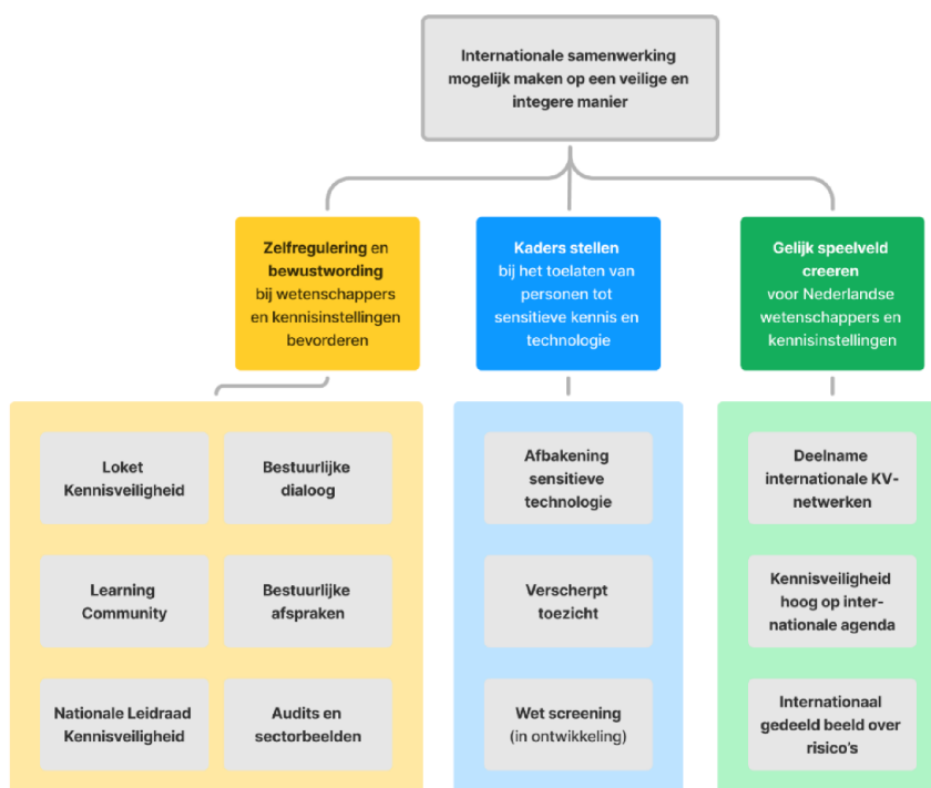
Figuur 1: aanpak kennisveiligheid hoger onderwijs en wetenschap