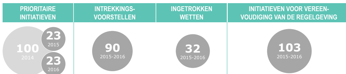
Grafiek 1. Betere regelgeving in cijfers voor 2015–2016

Tegelijkertijd is het aantal voorstellen van de Commissie aan het Europees Parlement en de Raad voor verordeningen en richtlijnen die volgens de gewone wetgevingsprocedure zouden moeten worden vastgesteld, gedaald van 159 in 2011 tot 48 in 2015. Het aantal richtlijnen en verordeningen dat het Parlement en de Raad sinds 2000 volgens de gewone wetgevingsprocedure hebben vastgesteld, varieert per jaar, met een piek van 141 in 2009. In 2015, het eerste jaar dat de Commissie-Juncker in functie was, was dat cijfer al gedaald tot 56.